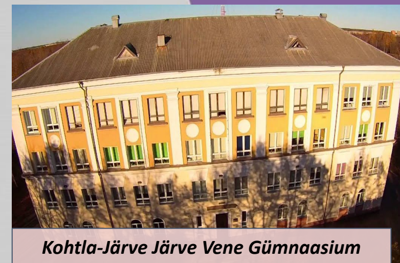
Kohtla-Järve Järve Vene Gümnaasium