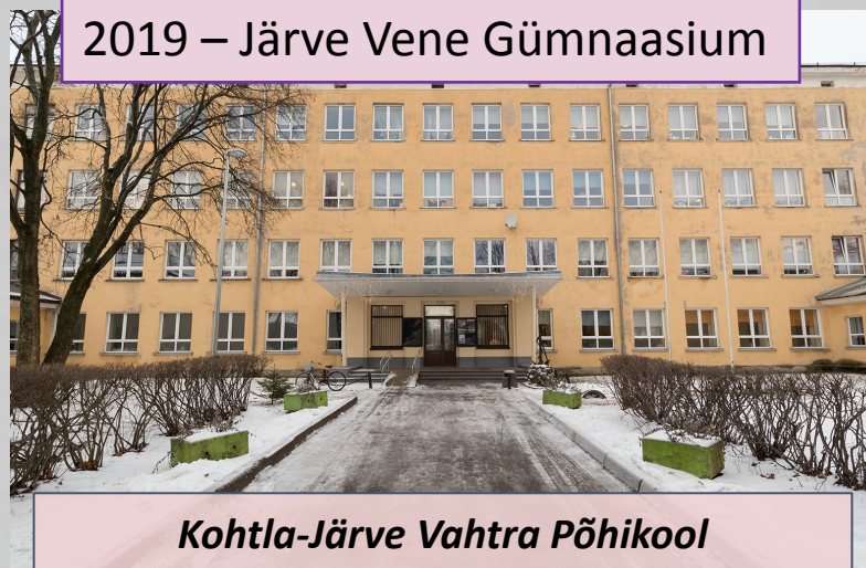
Kohtla-Järve Vahtra Põhikool