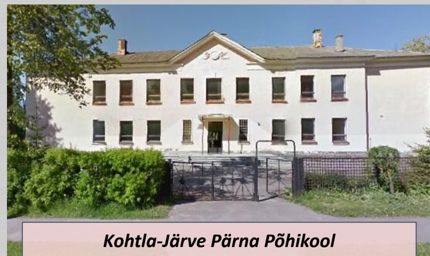
Kohtla-Järve Pärna Põhikool