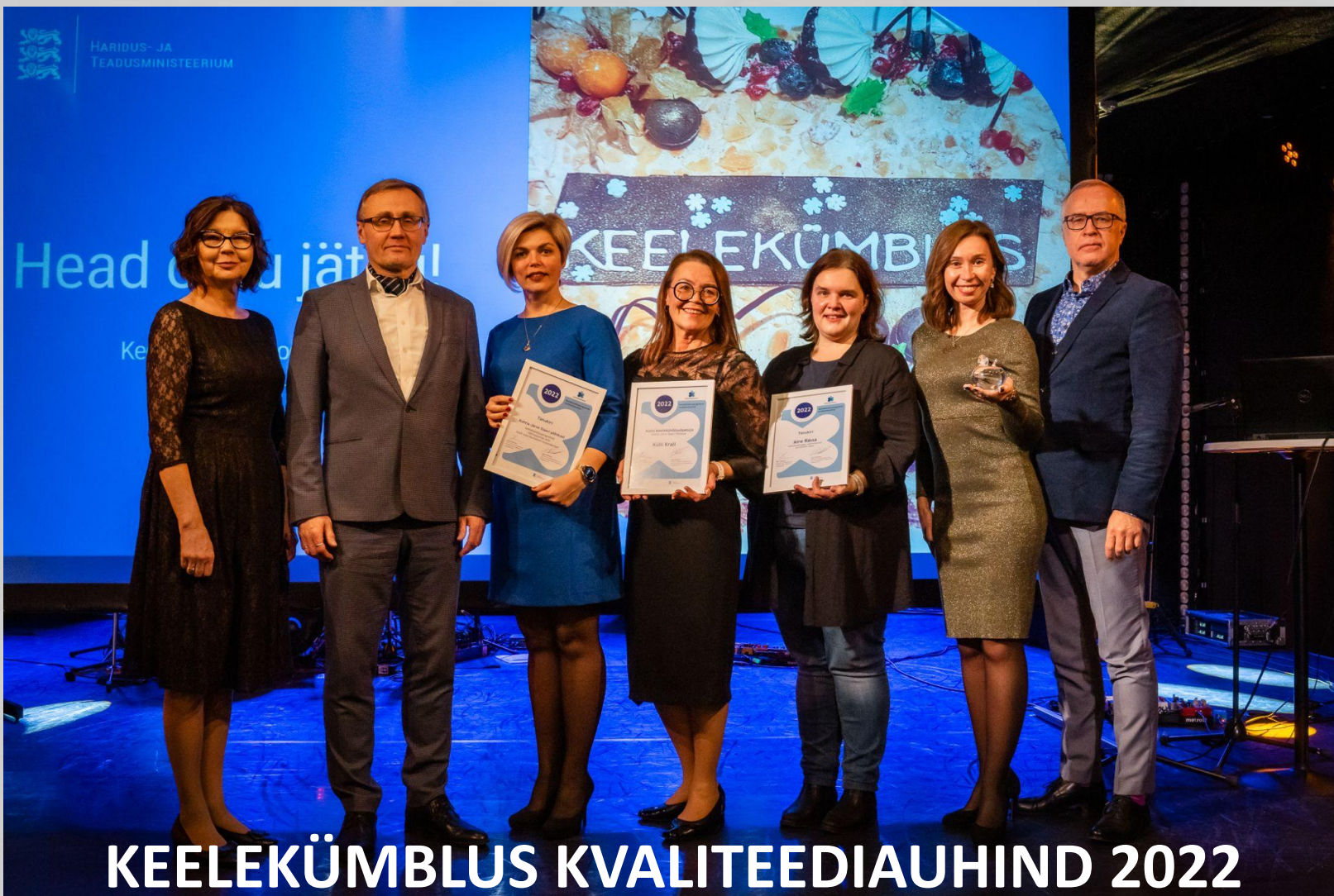
KEELEKÜMBLUS KVALITEEDIAUHIND 2022