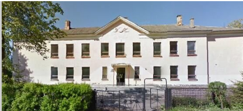
Kohtla-Järve Pärna Põhikool

§ 1. Alates 1. septembrist 2008. a, Kohtla-Järve Linnavalitsusel korraldada ümber Kohtla-Järve koolivõrk alljärgnevalt: liita Kohtla-Järve Pärna Põhikool Kohtla-Järve Slaavi Gümnaasiumiga, kusjuures Kohtla-Järve Pärna Põhikool lõpetab oma tegevuse.