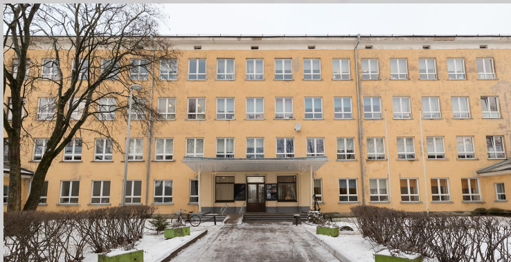
Kohtla-Järve Vahtra Põhikool