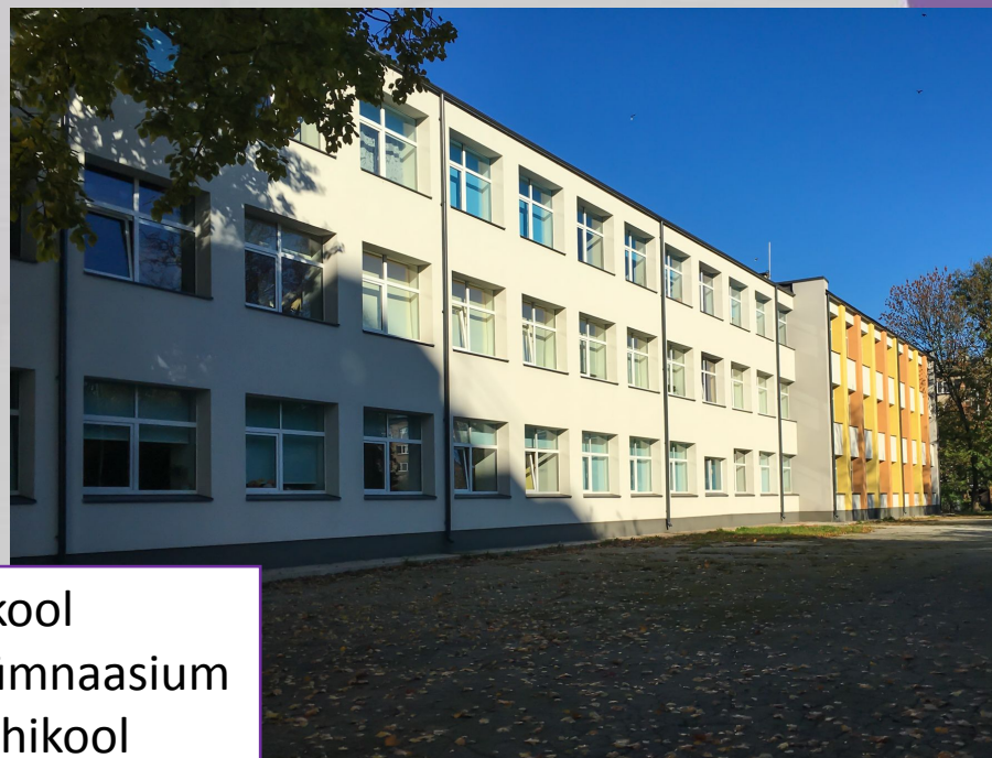
1965 – 13. keskkool 1997 – Slaavi Gümnaasium 2011 – Slaavi Põhikool