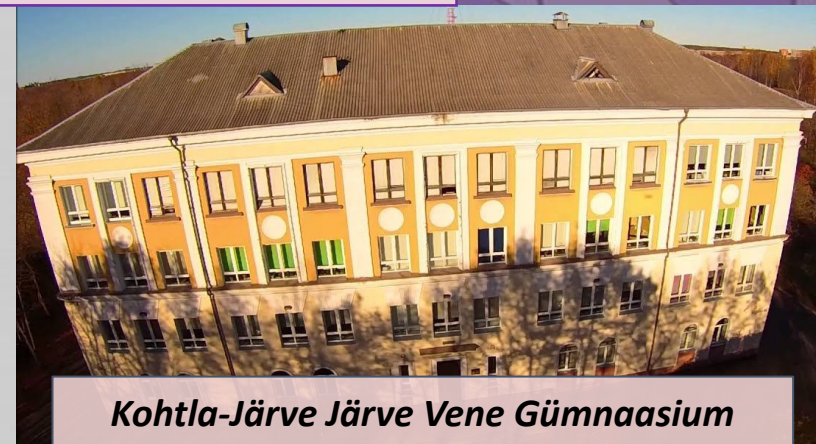
Kohtla-Järve Järve Vene Gümnaasium